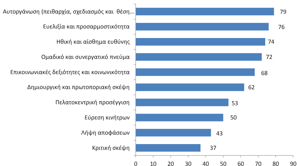
Σχήμα 3: Γενικές δεξιότητες που απαιτούνται στο εργασιακό περιβάλλον

Η έρευνα εστίασε στις γενικές και συγκεκριμένες ανά επάγγελμα δεξιότητες . Όπως φαίνεται και από το σχήμα 3, οι περισσότερες δεξιότητες που προσδιορίστηκαν από τους ερωτηθέντες ανήκουν στη γενική κατηγορία .