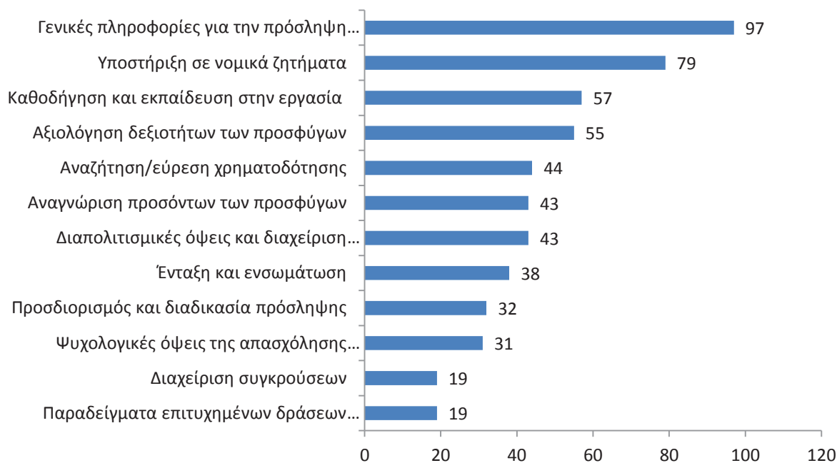
Σχήμα 4: Οι ανάγκες των εργοδοτών για εκπαίδευση και υποστήριξη

Όπως προέκυψε από την έρευνα, οι εργοδότες χρειάζονται γενικές πληροφορίες για την πρόσληψη και την ενσωμάτωση προσφύγων, καθώς και βοήθεια σε νομικά και διοικητικά ζητήματα . Οι πληροφορίες και οι επίσημες οδηγίες είναι συχνά περίπλοκες και μπερδεμένες . Υπό αυτό το πρίσμα, η υποστήριξη των εργοδοτών θα πρέπει να εστιάσει ιδιαίτερος στην παροχή δομημένης και σαφούς καθοδήγησης .